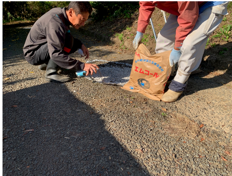
↑ エッジスプレー塗布